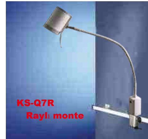
KS-Q7R Raylı monte