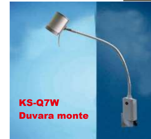
KS-Q7W Duvara monte