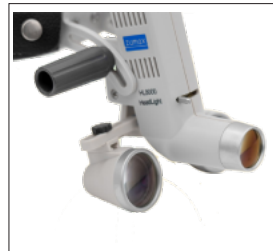
Zumax' n tüm Dürbün Büyüteçlerine uyum sa lar